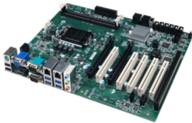
▲ Side view